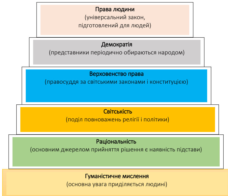
Рис. 1 Фундаментальні європейські цінності

Входження України до Європейського Союзу зумовлює дотримання цінностей, на яких засновано ЄС та які є фундаментом вільного, сучасного і демократичного суспільства. До них віднесено шість базових європейських цінностей (рис. 1) 17 :