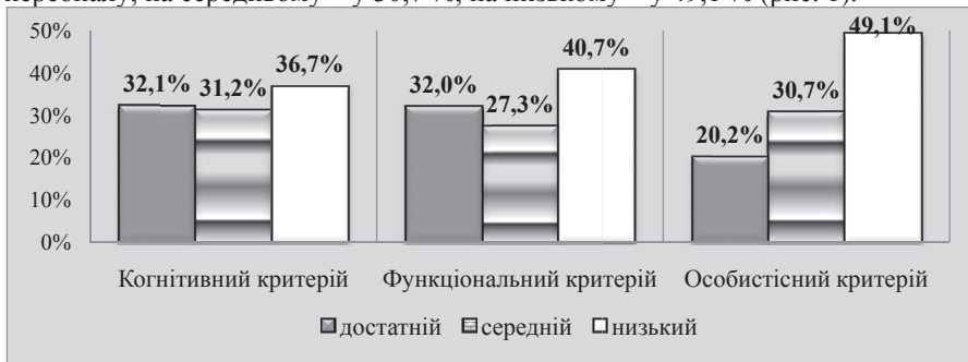
Рис. 1. Рівні сформованості професійної компетентності навчально-допоміжного персоналу (у %) за результатами анкетування навчально-допоміжного персоналу та експертів

Проведене дослідження дало можливість встановити, що за показниками когнітивного критерію професійна компетентність сформована на достатньому рівні у 32,1 % навчально-допоміжного персоналу, середньому – у 31,2 %, низькому – у 36,7 %; за показниками функціонального критерію сформовано на достатньому рівні у 32 % працівників, на середньому – у 27,3 %, на низькому – у 40,7 %; за показниками особистісного критерію сформовано на достатньому рівні у 20,2 % навчально-допоміжного персоналу, на середньому – у 30,7 %, на низькому – у 49,1 % (рис. 1).